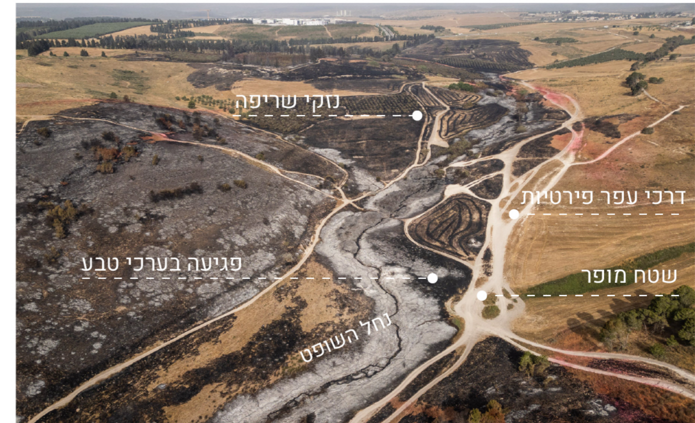
צילום: ניצן זוהר 2025